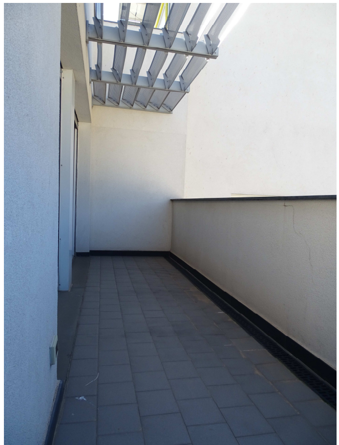
balcone lato OVEST