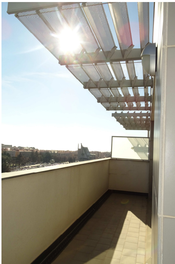
balcone lato EST