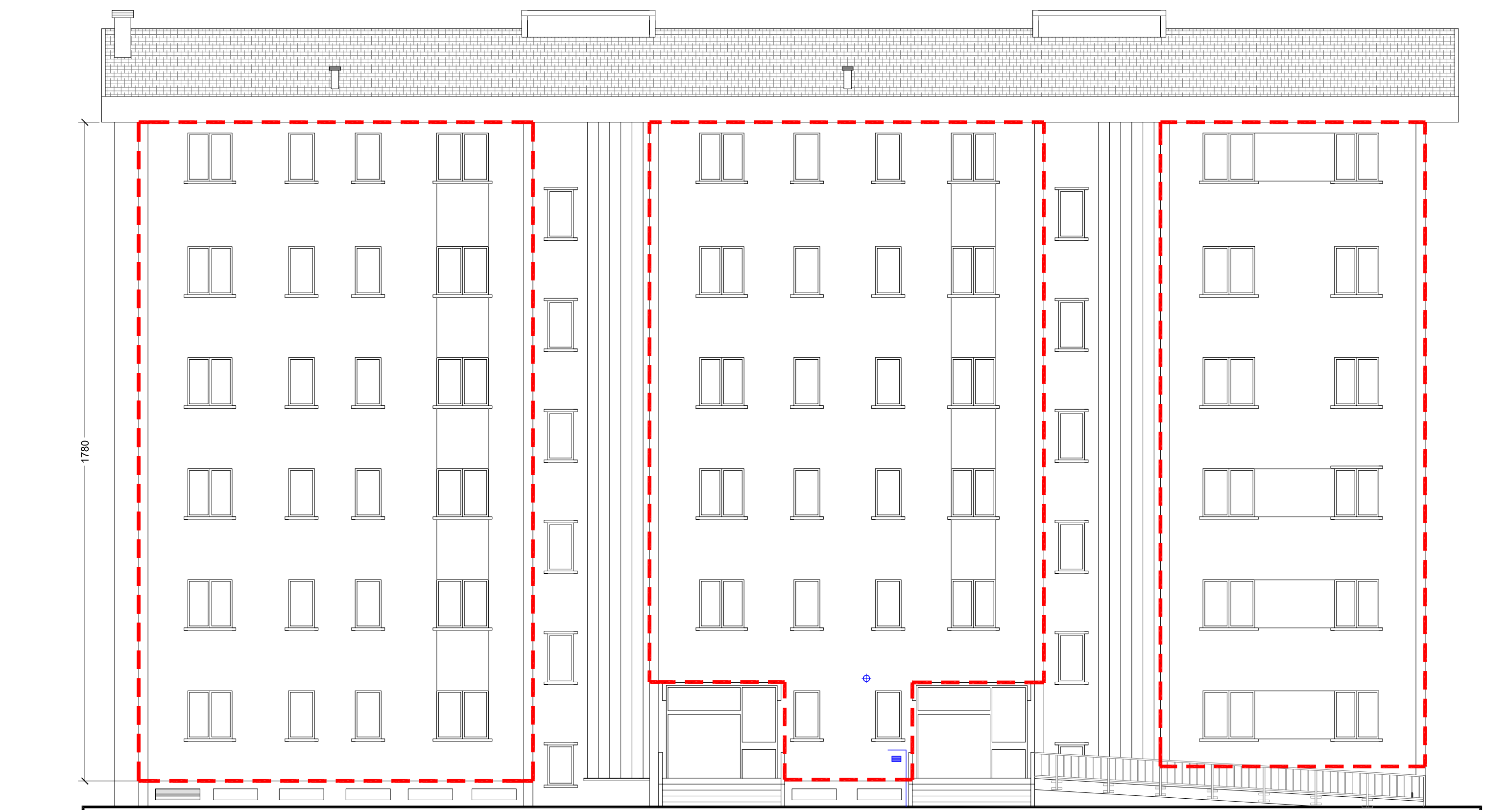
PROSPETTO EST - scala 1:100