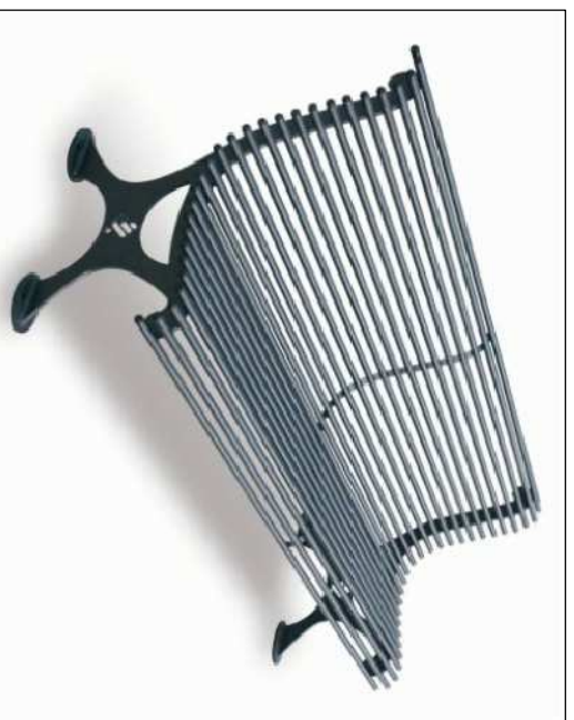
b - panchina