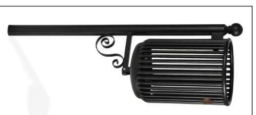
a - cestino